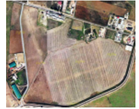
Fig. 4. Captura de pantalla de una ortofoto ofrecida por el SIGPAC. En ella podemos apreciar, casi a la perfección, la silueta del gran edificio sito en el término de Trruñuelos, (Córdoba)