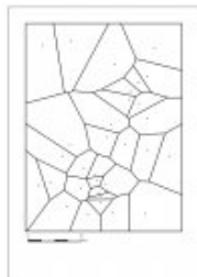
fig. 1. Distribución de asentamientos en un territorio. Los polígonos Thiessen marcan una hipotética zona de influencia para cada poblado (Imagen: Jesús García)

En España, hay que esperar hasta la década de los 80 para que, con 20 años de retraso con relación a Europa y América, comiencen a interesar las nuevas propuestas teóricas (RUIZ ZAPATERO Y FERNÁNDEZ MARTÍNEZ, 1993: 87; RUIZ ZAPATERO, 1996: 7; GARCÍA SANJUÁN, 2004: 186). Según Gonzalo Ruiz Zapatero (1996: 8-9), los pioneros de la lectura arqueológica del paisaje en España participaban de ciertos rasgos comunes: se trataba de jóvenes investigadores, conocedores del trabajo y las tendencias vigentes en el ámbito anglosajón, que desarrollaron su trabajo desde instituciones periféricas, alejadas de las grandes sedes académicas (en su mayoría ideológicamente tradicionales y reacias al cambio y las vanguardias), y todos ellos fuertemente influenciados y/o vinculados con corrientes teóricas alternativas a la Arqueología tradicional (Materialismo Histórico, Arqueología procesual o Arqueología contextual). Entre ellos destacan Arturo Ruiz y Francisco Burillo, desde los entonces Colegios Universitarios de Jaén y Teruel, respectivamente; Enrique Cerrillo, desde la Universidad de Extremadura, o Felipe Criado, desde la de Santiago.