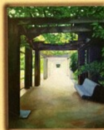
Dolores Gomariz Galindo