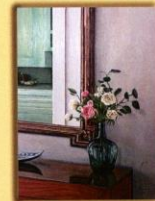
Dolores Gomariz Galindo