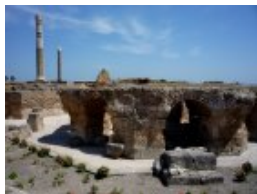
Restos de las termas romanas de Cartago.

del mundo conocido, siendo su destino un p blico muy concreto integrado por los lectores cultos del  mbito helen stico. El relato ofrece, sin duda, una cierta dosis de credibilidad, en la medida en que se fundamenta en la contrastada presencia p nica en las actuales costas de Marruecos, si bien a medida que la acci n se aleja de estos parajes conocidos el influjo de la fantas a parece incrementarse. Esa credibilidad exig a que los protagonistas de la acci n fueran cartagineses; en otro caso el relato habr a resultado inveros mil, ya que en esos tiempos la presencia griega en la zona era nula, debido a que los cartagineses controlaban de manera f rrea las aguas del Estrecho y sabemos por los cronistas antiguos que todos los nav os que se acercaban all  eran hundidos irremediablemente. En el caso hipot tico de que alguien hubiese intentado realizar este viaje fabuloso solo podr an haber sido los marinos de Cartago, lo que motiv  que el autor griego del relato, que conoc a esta circunstancia, decidiera incluirlos como protagonistas de su acci n.