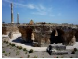
Restos de las termas romanas de Cartago.

del mundo conocido, siendo su destino un público muy concreto integrado por los lectores cultos del ámbito helenístico. El relato ofrece, sin duda, una cierta dosis de credibilidad, en la medida en que se fundamenta en la contrastada presencia púnica en las actuales costas de Marruecos, si bien a medida que la acción se aleja de estos parajes conocidos el influjo de la fantasía parece incrementarse. Esa credibilidad exigía que los protagonistas de la acción fueran cartagineses; en otro caso el relato habría resultado inverosímil, ya que en esos tiempos la presencia griega en la zona era nula, debido a que los cartagineses controlaban de manera férrea las aguas del Estrecho y sabemos por los cronistas antiguos que todos los navíos que se acercaban allí eran hundidos irremediablemente. En el caso hipotético de que alguien hubiese intentado realizar este viaje fabuloso solo podrían haber sido los marinos de Cartago, lo que motivó que el autor griego del relato, que conocía esta circunstancia, decidiera incluirlos como protagonistas de su acción.