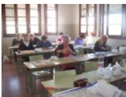
Foto 1. Taller (Asociación de mujeres Nuevo Amanecer)

Se inicia el primero de estos talleres en Marzo del año 2009 y fueron sus primeros alumnos nueve mujeres de la Asociación de Mujeres Nuevo Amanecer, que lograron realizar dieciocho mosaicos de 40x40 en el transcurso de sesenta horas de trabajo cada una de ellas, adquiriendo alguno de los mismos una aceptable calidad artística, lo que nos llevó a incidir en esta actividad a la vista de los resultados.